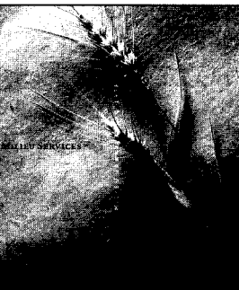
PMG heeft fraaie illustraties en is een goede kanshebber voor volgend jaar

In onze beoordeling (aan de hand van het UNEP-model) komen als "winnaars" van de verslagen over 1998 de verslagen van ARN en AVIRA uit de bus. Althans hebben ze een volledig en toegankelijk milieujaarverslag. Daarnaast valt het verslag van PMG Milieu Services op door het afwijkende formaat en de fraaie illustraties. Met iets meer informatie over de milieu-emissies zijn ze een goede kanshebber voor volgend jaar.